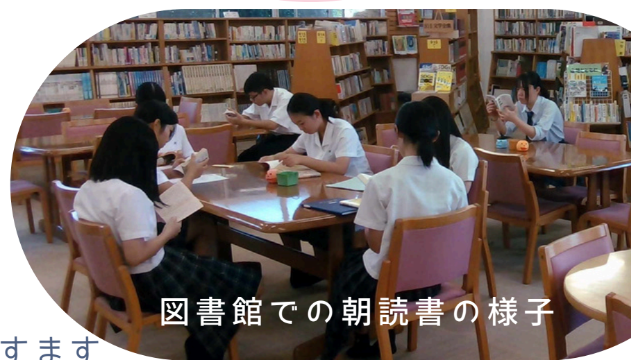
図書館での朝読書の様子

本校では、考査前1週間を除く通常授業日には毎朝8時30分から、10分間の「朝読書」を実施しています。ふだん本を読む時間がとれない生徒にとって、読書に取り組む貴重な時間となっています。また、学期に1度、クラス毎に図書館に登校してもらい、朝から本に囲まれ、落ち着いた環境で読書をしてもらう取組もしています。