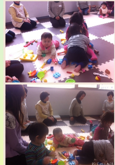
2月のパパママの様子

育休中の先生方のために癒し、おしゃべりの場所を準備しました。毎月第2水曜日10時から15時まで教育会館2階の一室を開放します。午前中はなにかイベントを入れます。(マッサージ、クラフト、講話等)お昼はお弁当をご持参下さい。毎月第2水曜日に開催予定です。