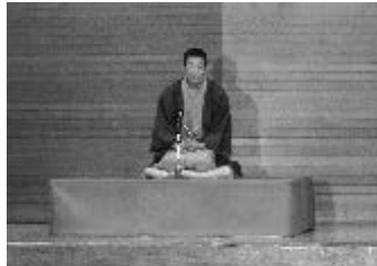
10月27日（火）9:20～ 宇土市立花園小学校（2公演） 児童（5・6年）238人 教職員20人