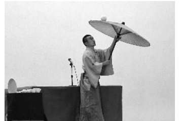
10月28日（水）13:30～ あさぎり町立岡原小学校 児童142人 教職員20人

お知らせ 次年度は令和2年7月豪雨による被害の大きかった地域を中心に復興支援寄席として行う予定です。（通常の募集は行いません。）