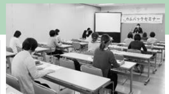
様々な制度がわかったので、学校長とも相談しながら活用していきたいです。（アンケートより）