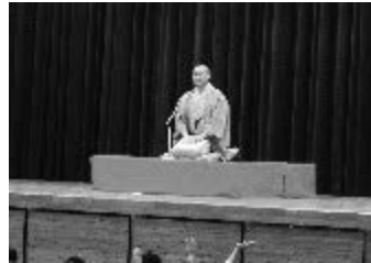
10月27日（火）14:10～ 宇城市立豊野生中学校 児童・生徒（小5～中3年）170人 教職員25人