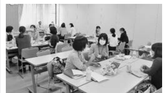
同じ育休中で復帰を考えている方々とお話ができ良かったです。（アンケートより）