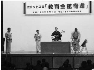
10月26日（月）13:40～ 熊本県立高森高等学校 生徒109人 教職員30人