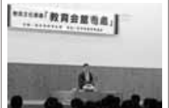
来年度の会館寄席開催の詳細については、平成28年1月下旬にホームページ掲載予定です。