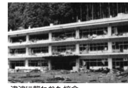
津波に襲われた校舎