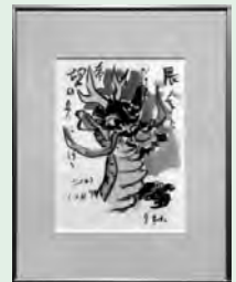
〔竜〕 宮中千秋 俳画展(1月)