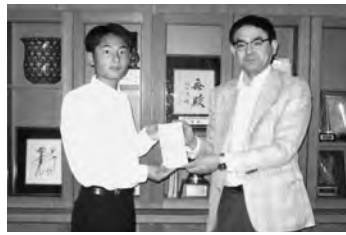
八代工業高等学校